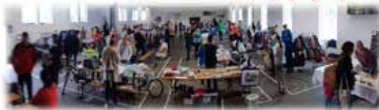
ZVR-Zahl: 195 44 17