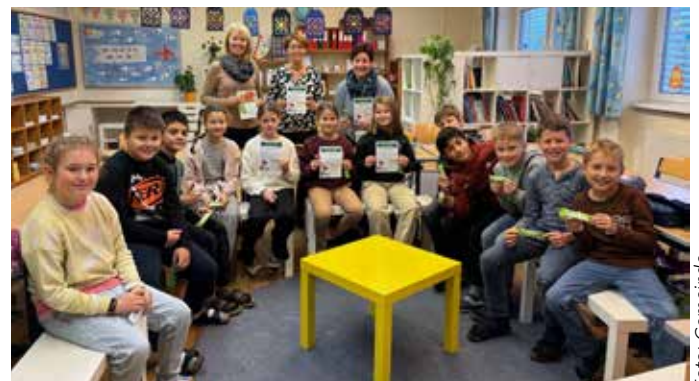
Arbeitskreisteam beim Verteilen an die Volksschulkinder

Im Rahmen des „Tag des Apfels“ wurden am 08. November 2024 in der Volksschule Inzersdorf, Freien Schule Kremstal am Magdalenaberg, im Kindergarten Inzersdorf sowie im Gemeindeamt, von der Gesunden Gemeinde Äpfel in Form von Müsliriegeln ausgeteilt. Die Müsliriegel brachten nicht nur Energie, sondern auch ein Lächeln auf die Gesichter der Kleinen und Großen!